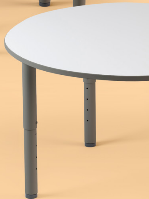
tavoli studio e condivisione